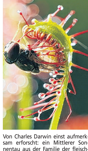
Von Charles Darwin einst aufmerksam erforscht: ein Mittlerer Sonnentau aus der Familie der fleischfressenden Pflanzen.

200 Jahre nach Darwins Geburt kennen die Botaniker übrigens mehr als 600 Arten von Pflanzen, die Tiere fangen und verdauen. Nur die Frage nach der Signalleitung bei den Fangbewegungen, die Darwin so interessiert hatte, ist bis heute nicht restlos geklärt.